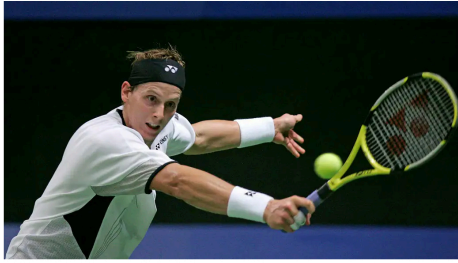
Joachim "Pim-Pim" Johansson besegrade Rafael Nadal i Stockholm Open 2006 med setsiffrorna 6-4, 7-6.

"Pim-Pim" blev som bäst nia i världen, hade ett tag världsrekordet i antal serveess i en match (51) och är fortfarande en av dem som servat hårdast i tennishistorien.